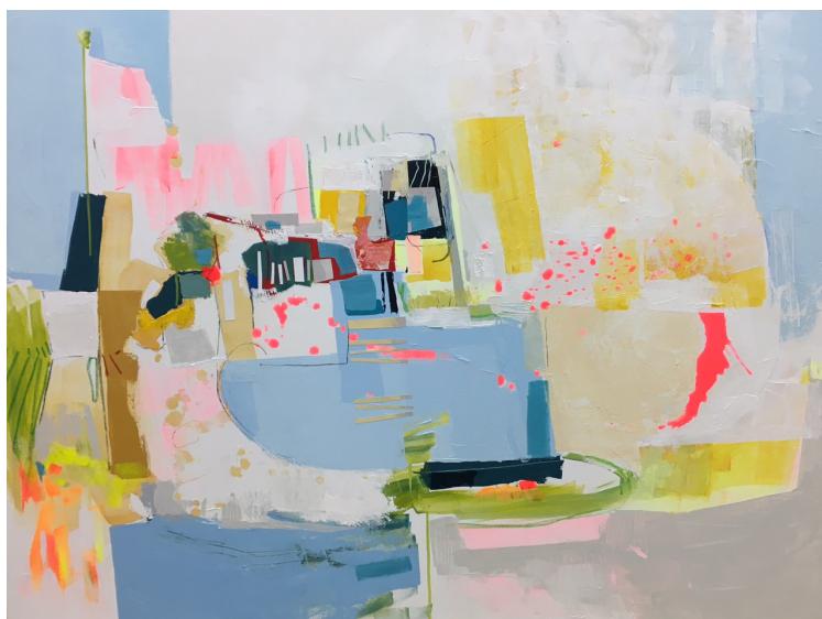
Ici bas- Acrylique sur toile- 97 x 130 cm

Vernissage jeudi 30 mars 2017 de 18h à 21 h